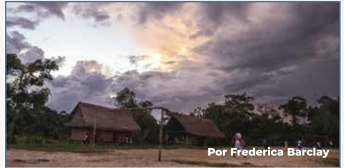
Por Frederica Barclay