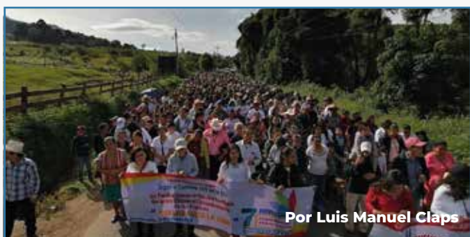
Por Luis Manuel Claps