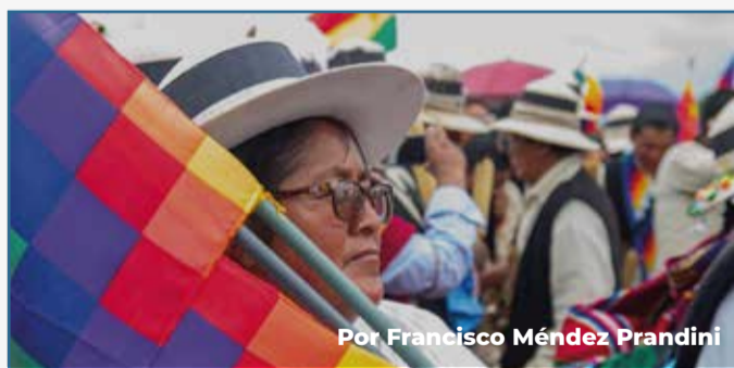
Por Francisco Méndez Prandini