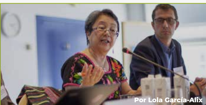
Por Lola García-Alix