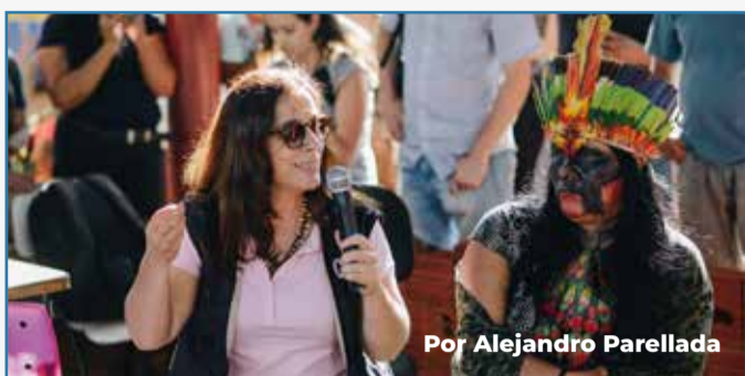
Por Alejandro Parellada