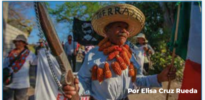
Por Elísa Cruz Rueda