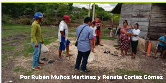
Por Rubén Muñoz Martínez y Renata Cortez Gómez