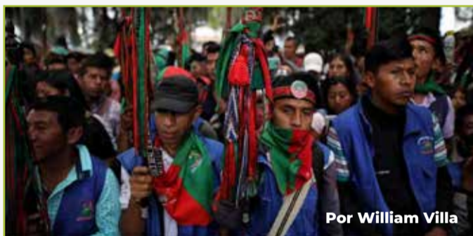
Por William Villa