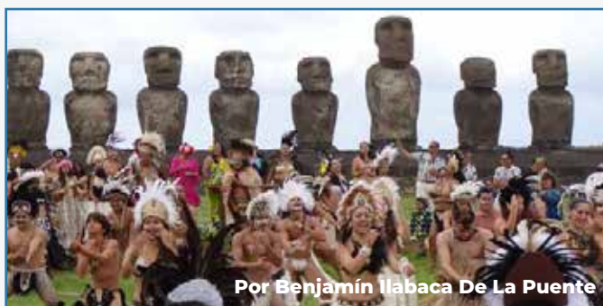
Por Benjamín Ilabaca De La Puente