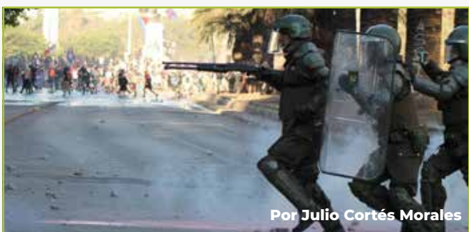
Por Julio Cortés Morales