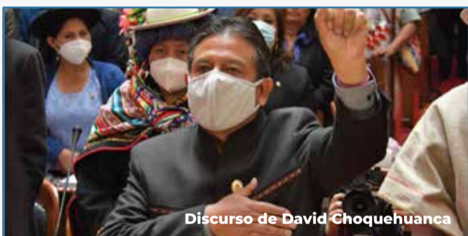
Discurso de David Choquehuanca