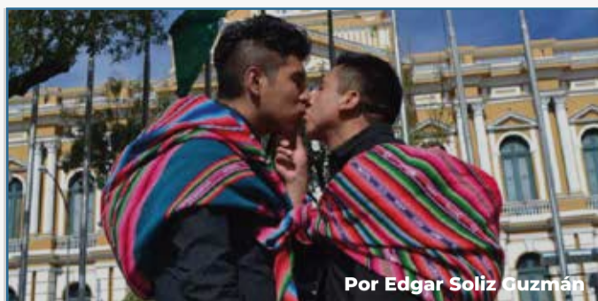
Por Edgar Soliz Guzmán