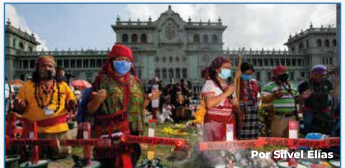
Por Silvel Elías