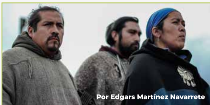
Por Edgars Martínez Navarrete