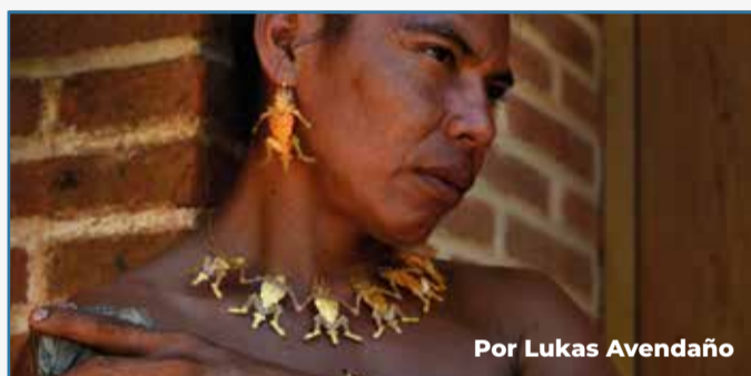
Por Lukas Avendaño