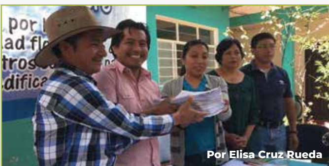
Por Elisa Cruz Rueda