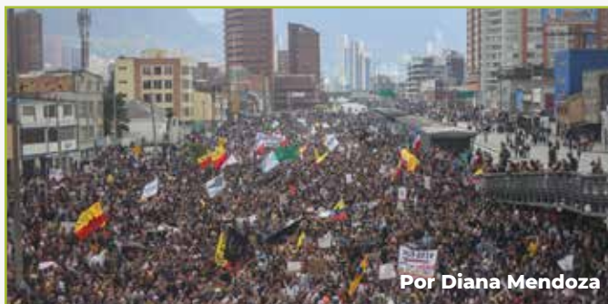
Por Diana Mendoza