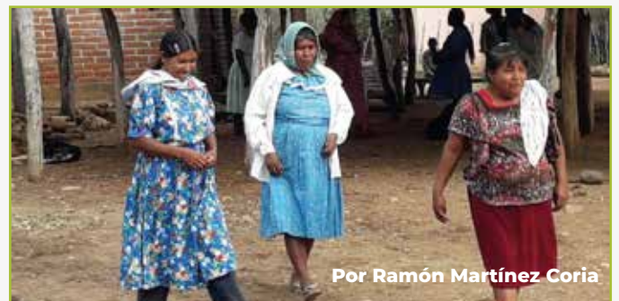
Por Ramón Martínez Coria