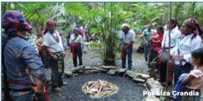
Por Liza Grandia