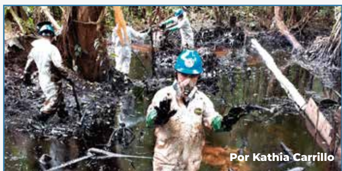
Por Kathia Carrillo