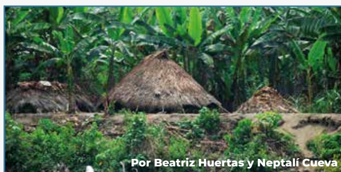
Por Beatriz Huertas y Neptalí Cueva