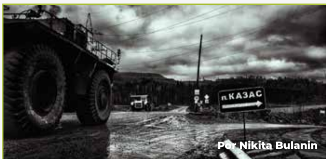
Por Nikita Bulanin