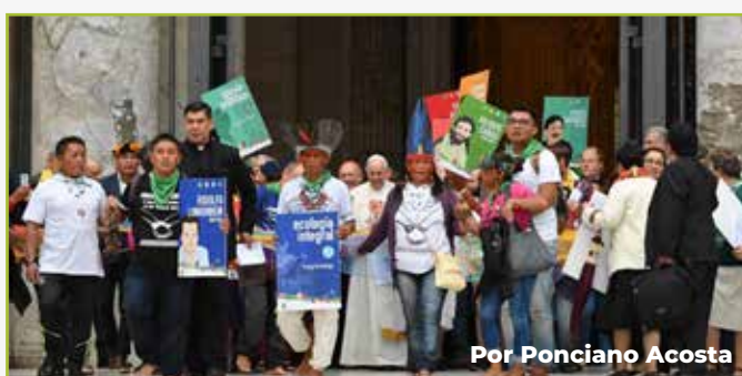
Por Ponciano Acosta