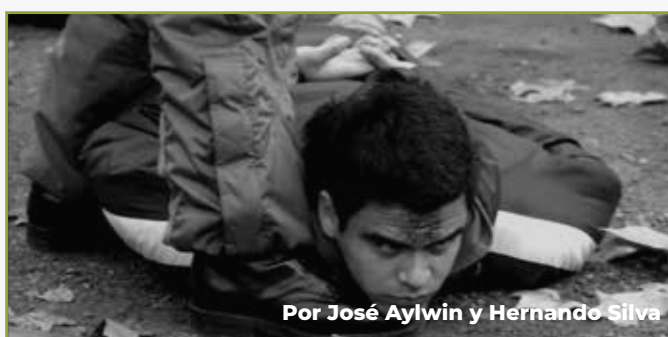
Por José Aylwin y Hernando Silva