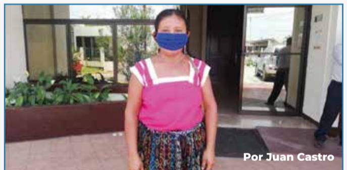
Por Juan Castro