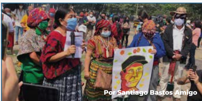
Por Santiago Bastos Amigo