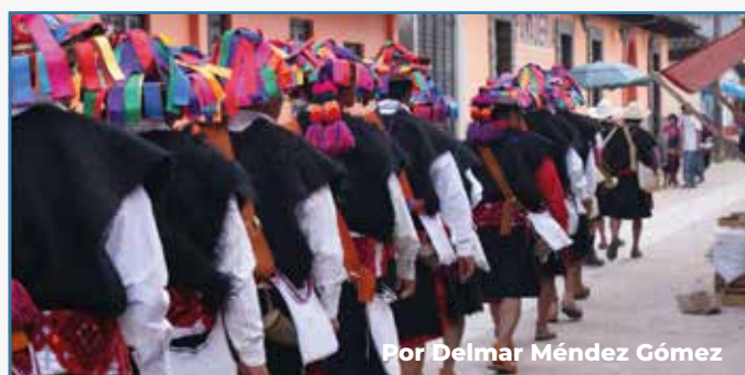
Por Delmar Méndez Gómez