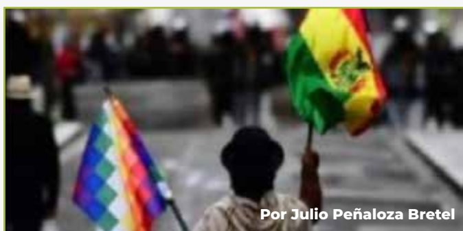
Por Julio Peñaloza Bretel