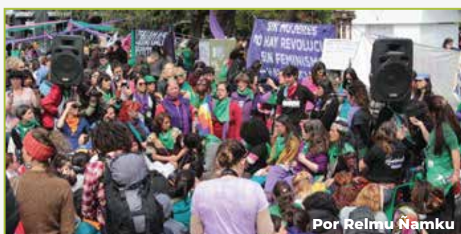
Por Relmu Namku