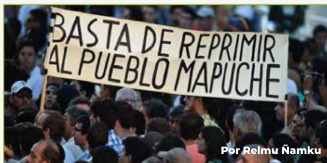
Por Relmu Ñamku