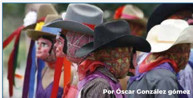
Por Óscar González gómez