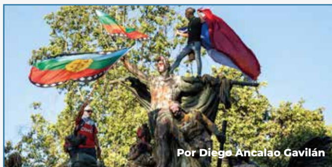
Por Diego Ancalao Gavilán