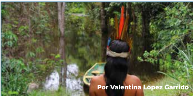
Por Valentina López Garrido