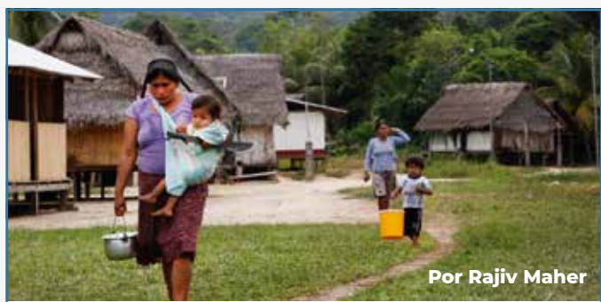
Por Rajiv Maher