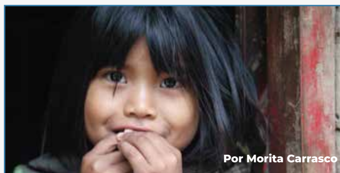
Por Morita Carrasco