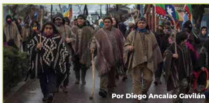
Por Diego Ancalao Gavilán