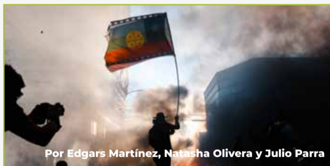
Por Edgars Martínez, Natasha Olivera y Julio Parra