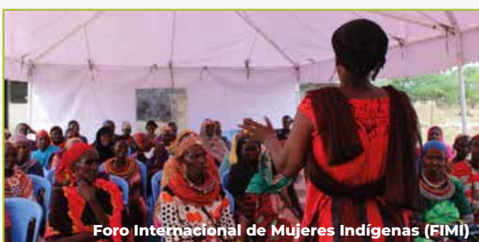
Foro Internacional de Mujeres Indígenas (FIMI)