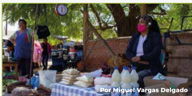
Por Miguel Vargas Delgado