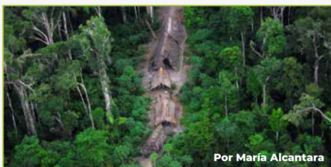
Por María Alcantara