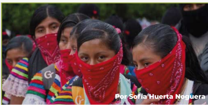
Por Sofía Huerta Noguera