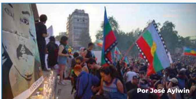
Por José Aylwin