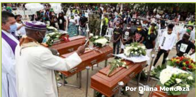
Por Diana Mendoza