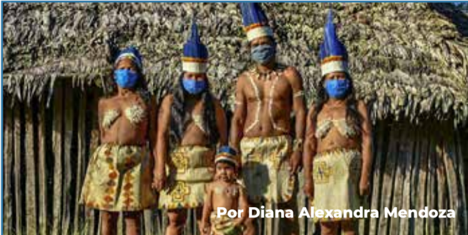
Por Diana Alexandra Mendoza