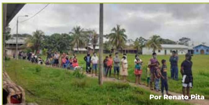
Por Renato Pita