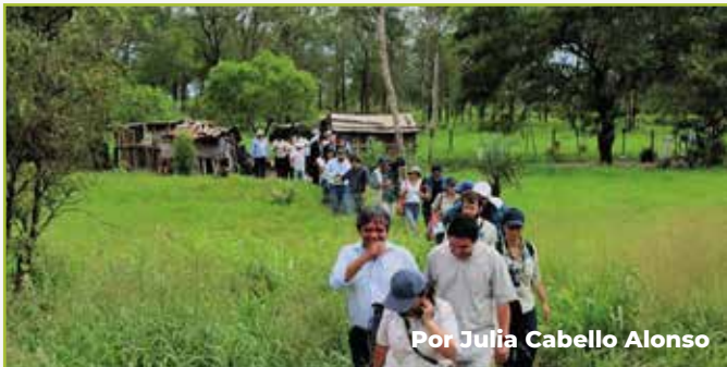
Por Julia Cabello Alonso