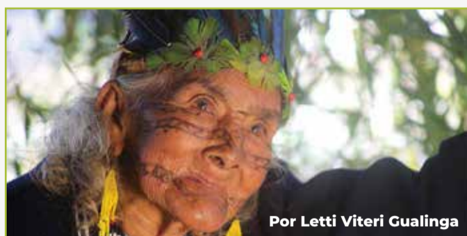
Por Letti Viteri Gualinga