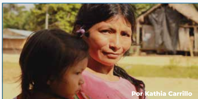
Por Kathia Carrillo