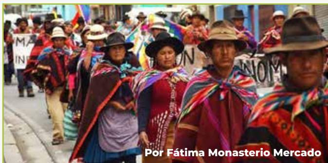
Por Fátima Monasterio Mercado