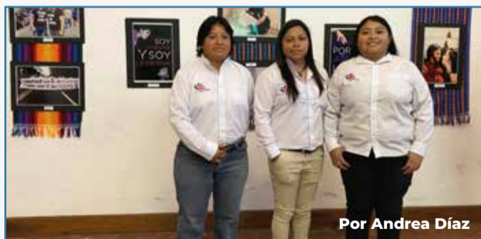
Por Andrea Díaz