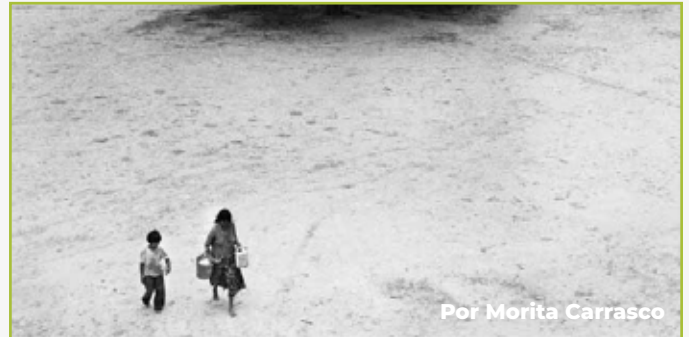
Por Morita Carrasco