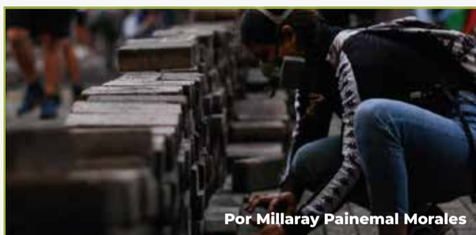
Por Millaray Painemal Morales