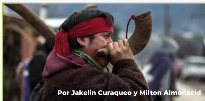
Por Jakelin Curaqueo y Milton Almonacid