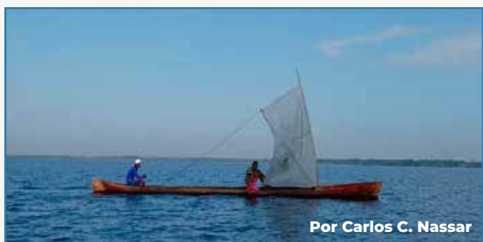
Por Carlos C. Nassar