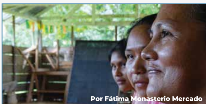
Por Fátima Monasterio Mercado