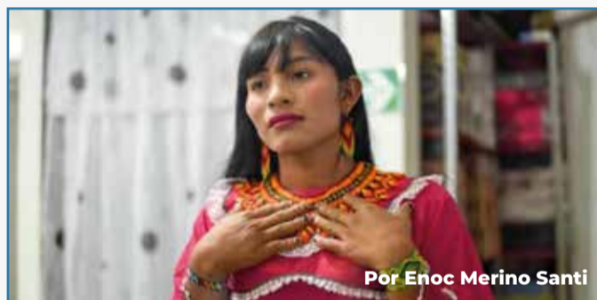
Por Enoc Merino Santi