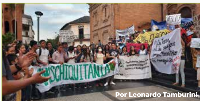
Por Leonardo Tamburini