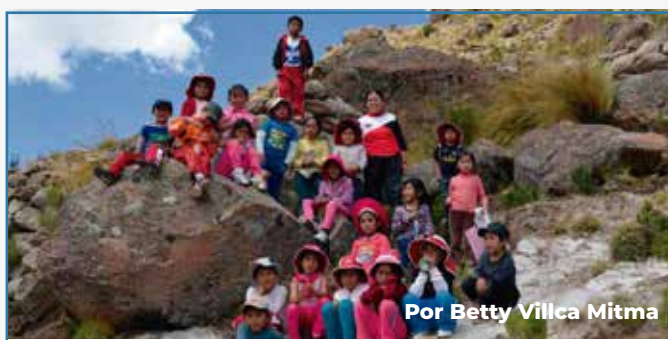
Por Betty Vilca Mitma